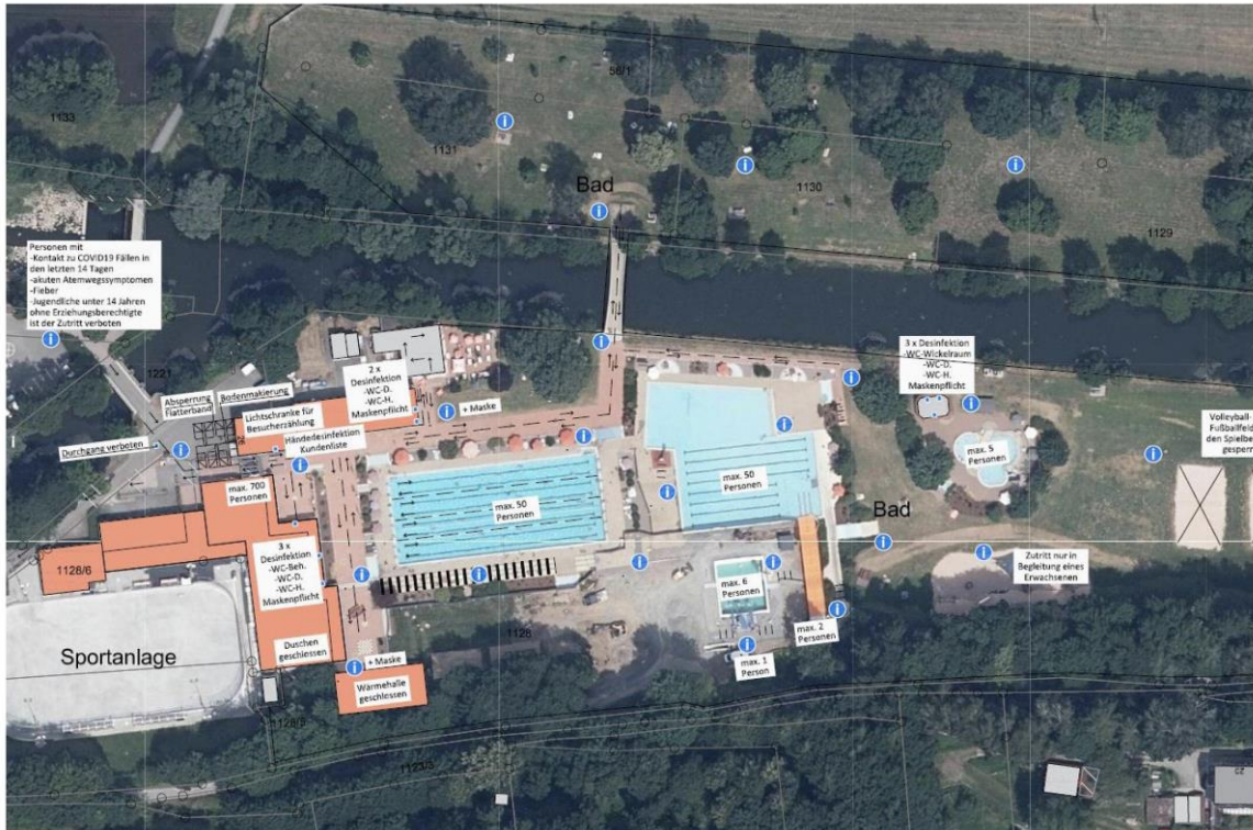
Wege werden abgetrennt und dürfen nur in eine Richtung begangen werden. Die Zahl der Besucher und der Schwimmer in den Becken ist begrenzt. In allen Bereichen ("I" im blauen Kreis) ist 1,50 Meter Abstand zu anderen Personen einhalten. Es stehen Desinfektionsspender und Einmalhandtücher zur Verfügung. Grafik: Stadt Kulmbach

Die Saison kann mit einem umfangreichen Schutz- und Hygienekonzept beginnen.